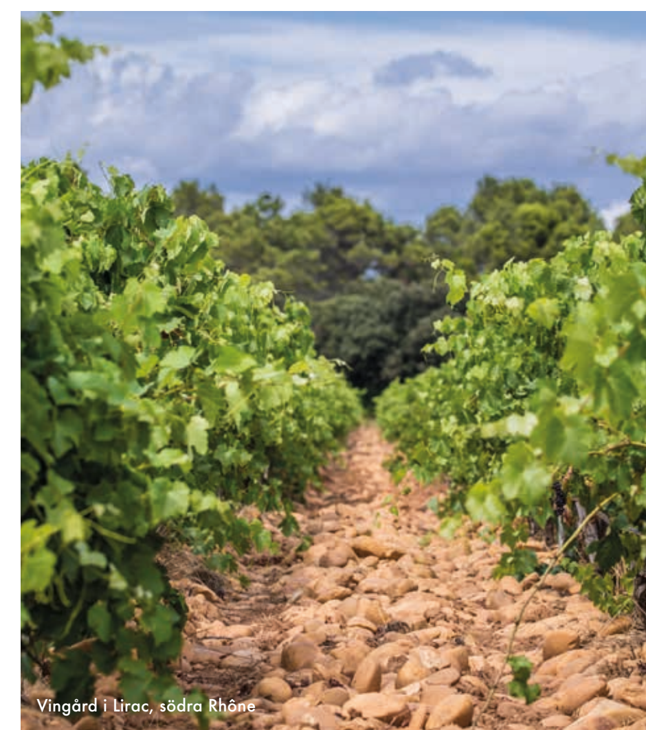
Vingård i Lirac, södra Rhône