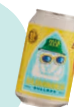
Gotlands Bryggeri Summer Bulldog Pale Ale Sverige / 33770 20,90 kr + 2 kr i pant

Hyllning till den gotländska sommaren som passar fint i hela vårt avlånga land. Krispig, ljus och lättam ale med friska och citrusfruktiga humlearomer, solig melon och blommig fläder.