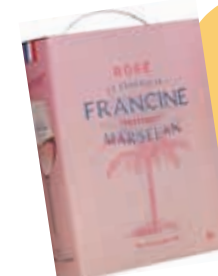
La Genereuse Francine, 2025 Frankrike / 2394 245 kr (3000 ml)

Läskande frisk smak med en palett av allt man kan önska sig hos ett sydfranskt rosévin. Proppad av röda bär, solmogen persika, en bukkett örter och behaglig beska från blodgrape.