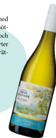
CHILL OUT Terre Siciliane Catarratto Zibibbo Organic, 2023 Italien / 55208 / 83 kr Ekologiskt

Ungdomlig sicilianare med blommig ton, inslag av söta, honungsmelon, fläder och persika. Sippvänligt och knyter ihop picknickens alla smärter och smaker.