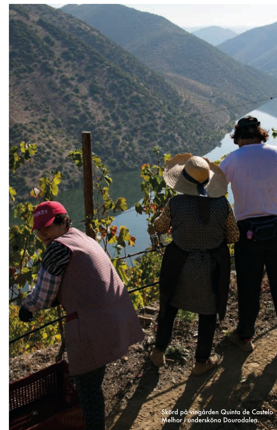
Skörd på vingården Quinta de Castelo Melhor i undersköna Dourodalen.