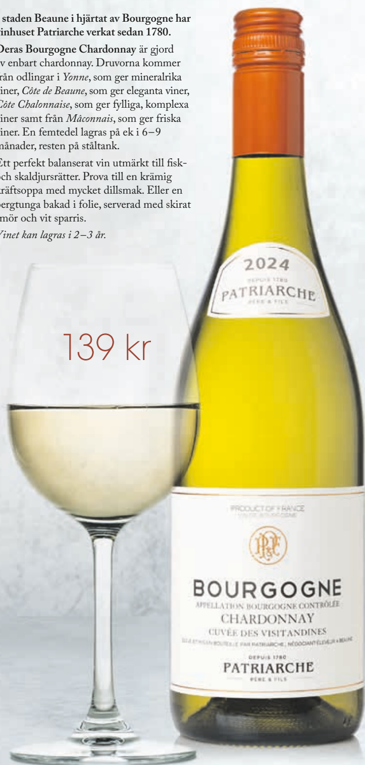
2024 Patriarche Bourgogne Chardonnay "Cuvée des Visitandines" 139 kr. Varunr. 71159. 12.5% vol. Finns i alla Systembolagets butiker.