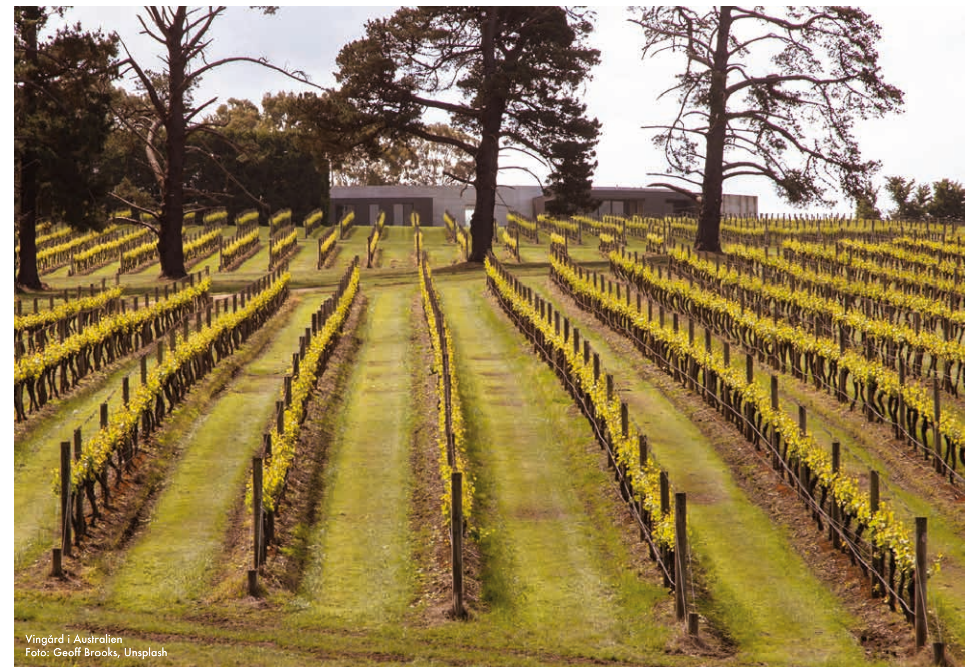
Vingård i Australien

Syran är rieslings ryggrad. Den ger vinet dess energi och livslängd, men också dess flexibilitet vid matbordet. Just därför är rieslingviner några av de mest mångsidiga matvinerna som finns och passar allt från aperitif till dessert. De kan möta allt från salta och syrliga rätter till kryddstark mat och söta inslag, ofta med en självklarhet som få andra druvor klarar av. Torra viner är lämpliga till fisk, skaldjur, fågel och ljust kött. Vin med lite sötma passar