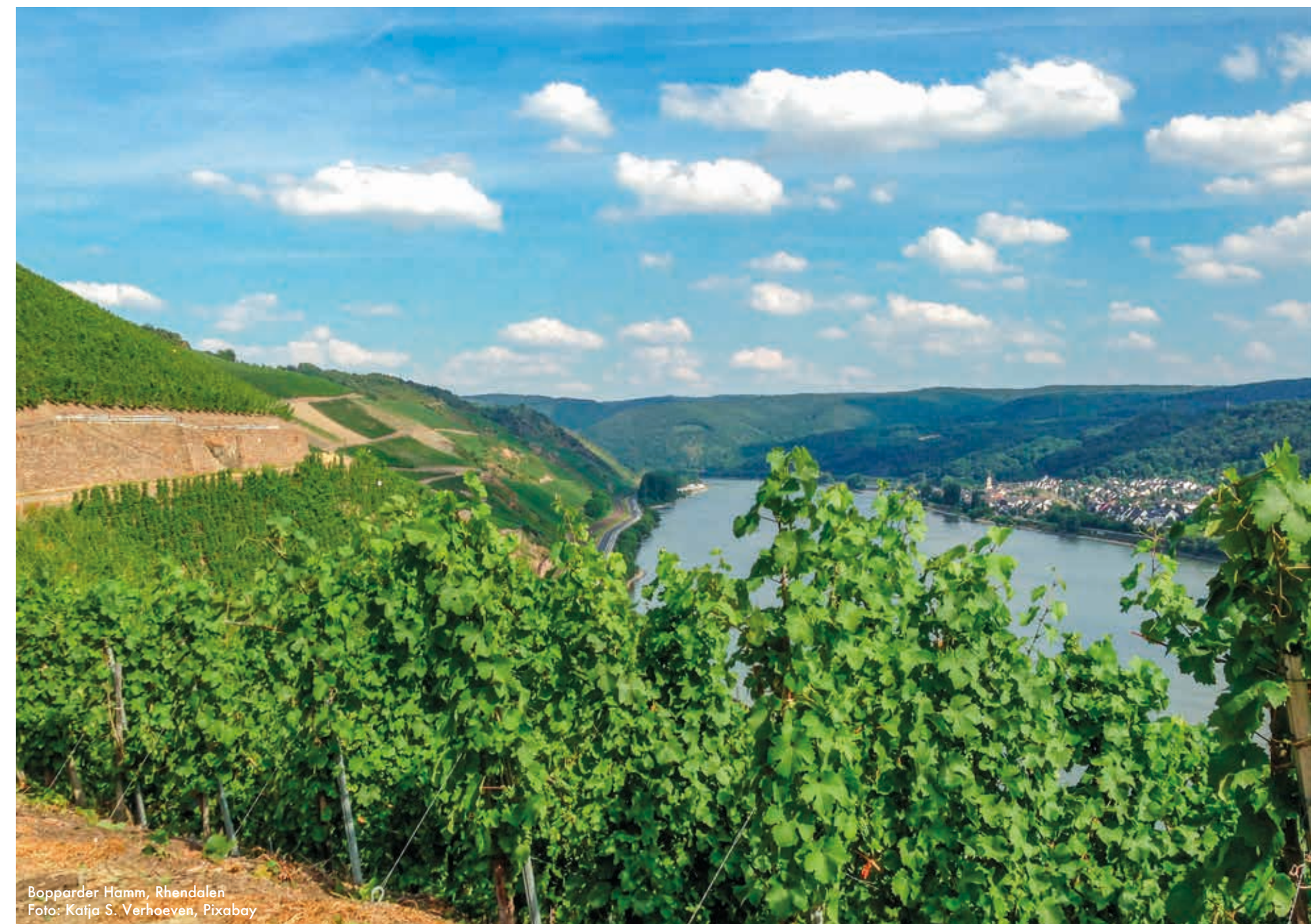
Bopparder Hamm, Rhendalen